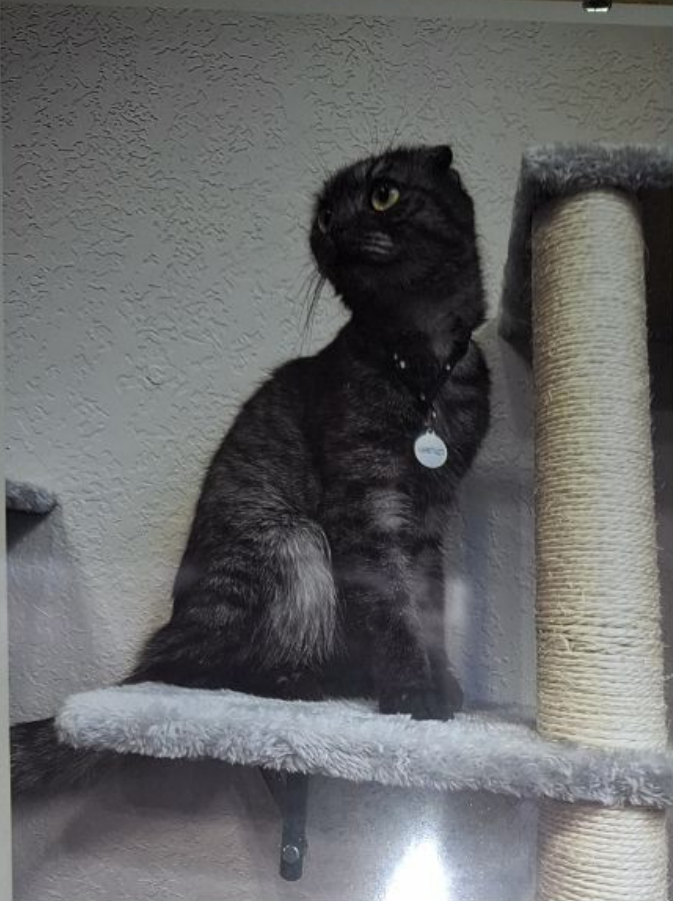
↖ Булка (01.01.2025)

Мене звуть Булка, я - горда шотландська висловуха кішка. Мене знайшли в Чернівцях в одному з під'їздів на вулиці Південно-Кільцевій, і саме в цей день почалась моя історія, адже я не знаю людської мови і не можу розказати, звідки я там взялась - можливо, я загубилась, а можливо, мене покинули мої люди. За час перебування на вулиці я підцепила неприємний і дуже небезпечний вірус, проте мене змогли вилікувати. Знайти моїх власників так і не вдалося, і тому зараз ви бачите мене тут - здоровою, щасливою, грайливою ніжну і завжди готову до ваших обіймів.