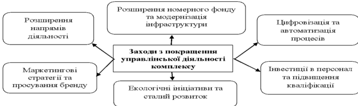
Рис. 3.2. Пропозиції з впровадження ефективного менеджменту та покращення функціонування комплексу

Джерело: побудовано автором за даними [23]