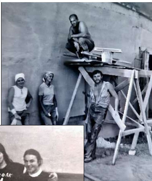
Бригада штукатурів студентського будівельного загону «Дружба» (початок 1970-х рр.) (# 9)