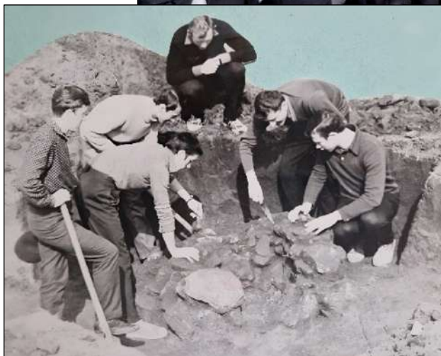
Студенти-історики на археологічній практиці (1971 р.) (# 9)