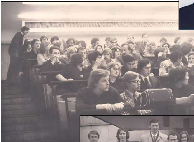
На парах (1970-і рр.) (# 2)