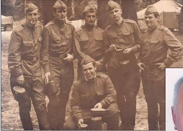
Студенти-історики на військовій кафедрі (1970-і рр.) (# 2)