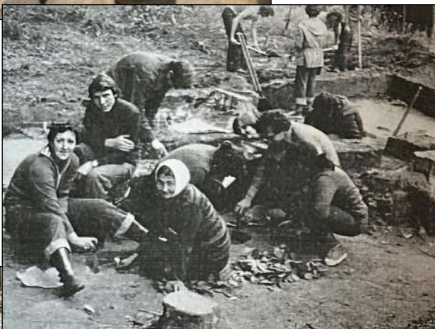
Студенти-історики на археологічній практиці (кінець 1970-х – початок 1980-х рр.) (# 8)