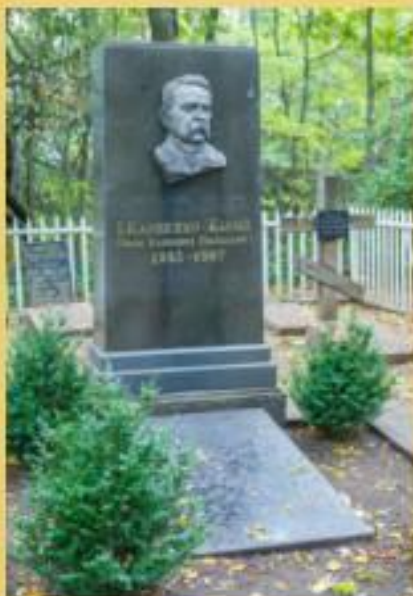
Могила І. Тобілевича поблизу хутора