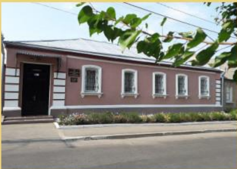
Музей І.К. Карпенка-Карого (м. Кропивницький)

Київський національний університет театру, кіно і телебачення носить ім'я І.К. Карпенка-Карого.