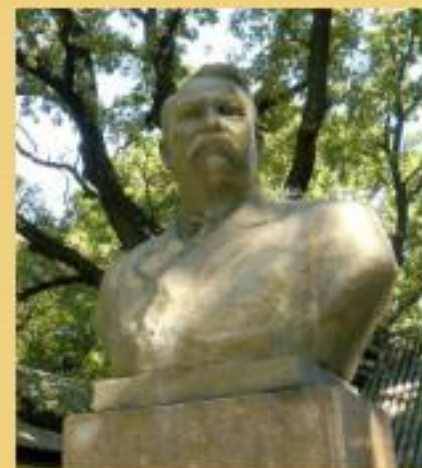
Пам'ятник Івану Карпенко — Карому роботи скульптора Ковальова 1969 р.