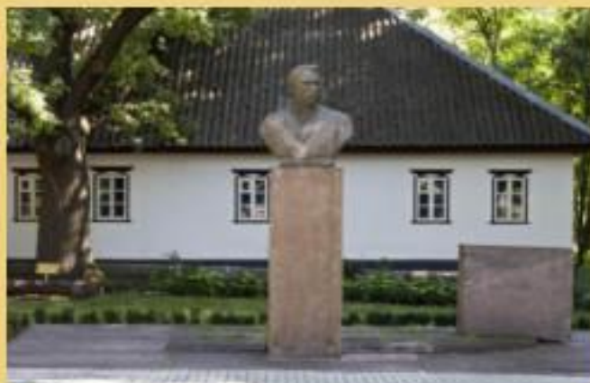
Будинок, побудований драматургом, Нині меморіальний музей "Хутір Надія"