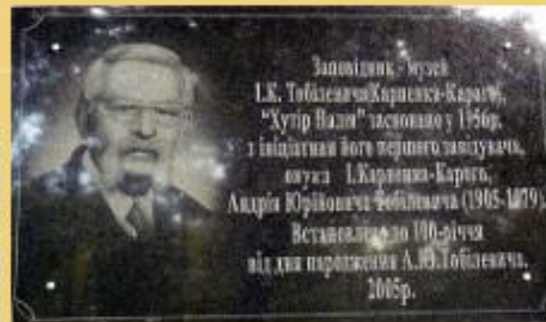
Меморіальна дошка на вході до музею