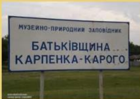
Заповідник у селі Арсенівка над річкою Вись, в якому 29 вересня 1845 році народився І. Тобілевич