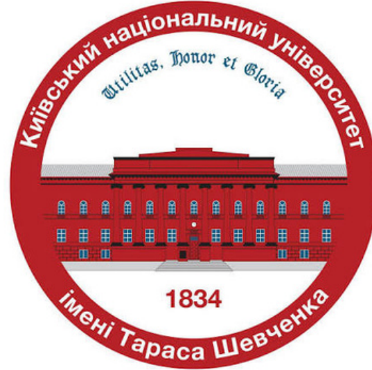
КИЇВСЬКИЙ НАЦІОНАЛЬНИЙ УНІВЕРСИТЕТ ІМЕНІ ТАРАСА ШЕВЧЕНКА кафедра фінансів (Україна)