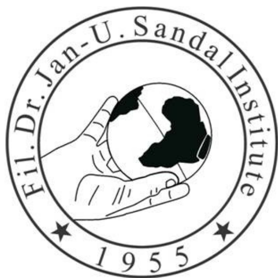
FIL. DR. JAN-U. SANDAL INSTITUTE (Norway)

ОРГАНІЗАТОРИ ОРГАНІЗАТОРИ ОРГАНІЗАТОРИ ОРГАНІЗАТОРИ ОРГАНІЗАТОРИ ОРГАНІЗАТОРИ ОРГАНІЗАТОРИ