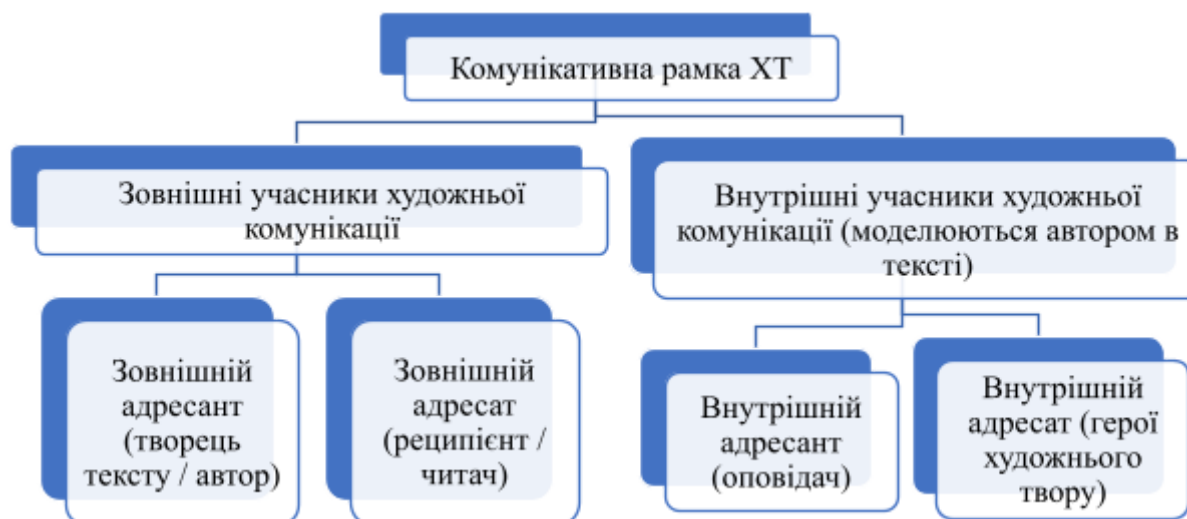
Рис. 1.1. Комунікативна рамка ХТ